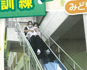
すべり台で避難しました