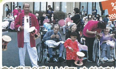
米倉お囃子会盛り上げていただきました