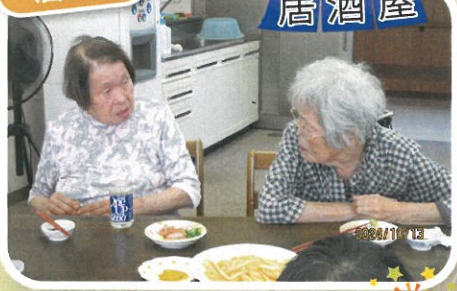
ほろ酔いで 愚痴も出る仲の良さ