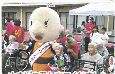
ゆきどの君も来てくれました