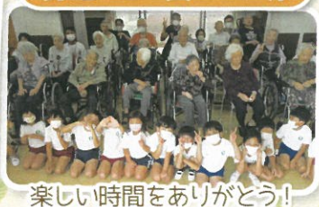
楽しい時間をありがとう!