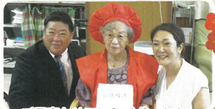
ご長寿おめでとうございます!