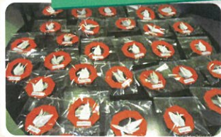
認定こども園さん様より 敬老お祝いをいただきました