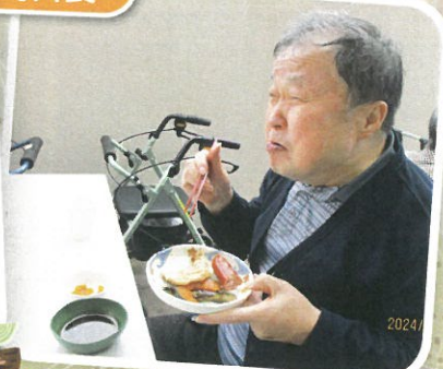
おいしさ、はじける笑顔です