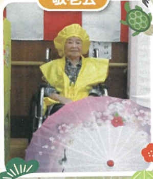
祝 102 才 おめでとうございます