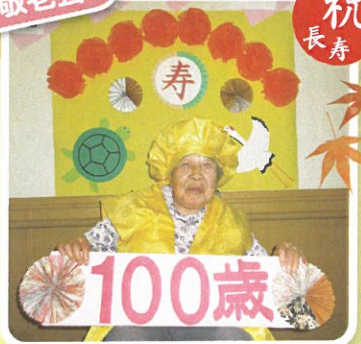
100歳です!! これからも元気でいて下さいね!!