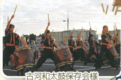
古河和太鼓保存会様