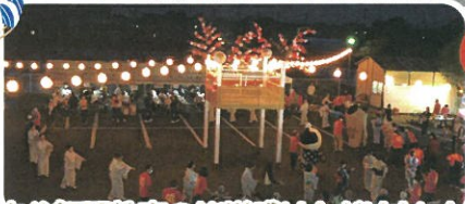
古谷舞踊教室の皆様盛り上がりました