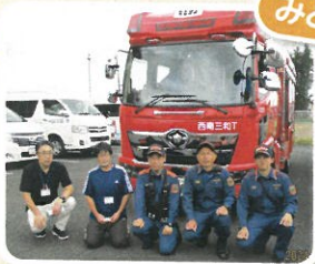
三和消防分署様 ご協力ありがとうございました