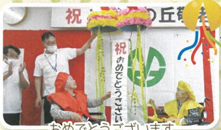
祝みどりの丘敬老会 おめでとうございます