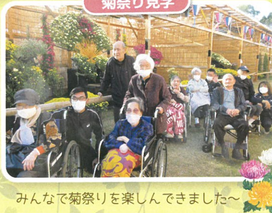
みんなで菊祭りを楽しんできました～