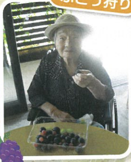
旬のぶどうは甘くておいしい!