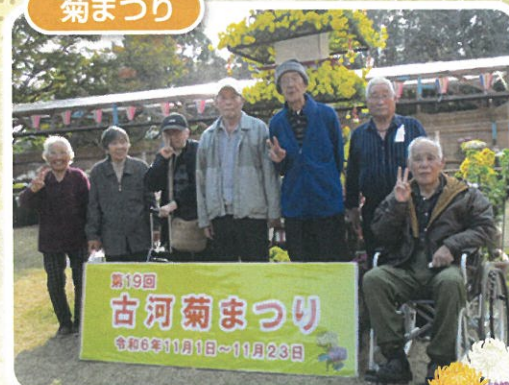
菊まつりに行ってきました~