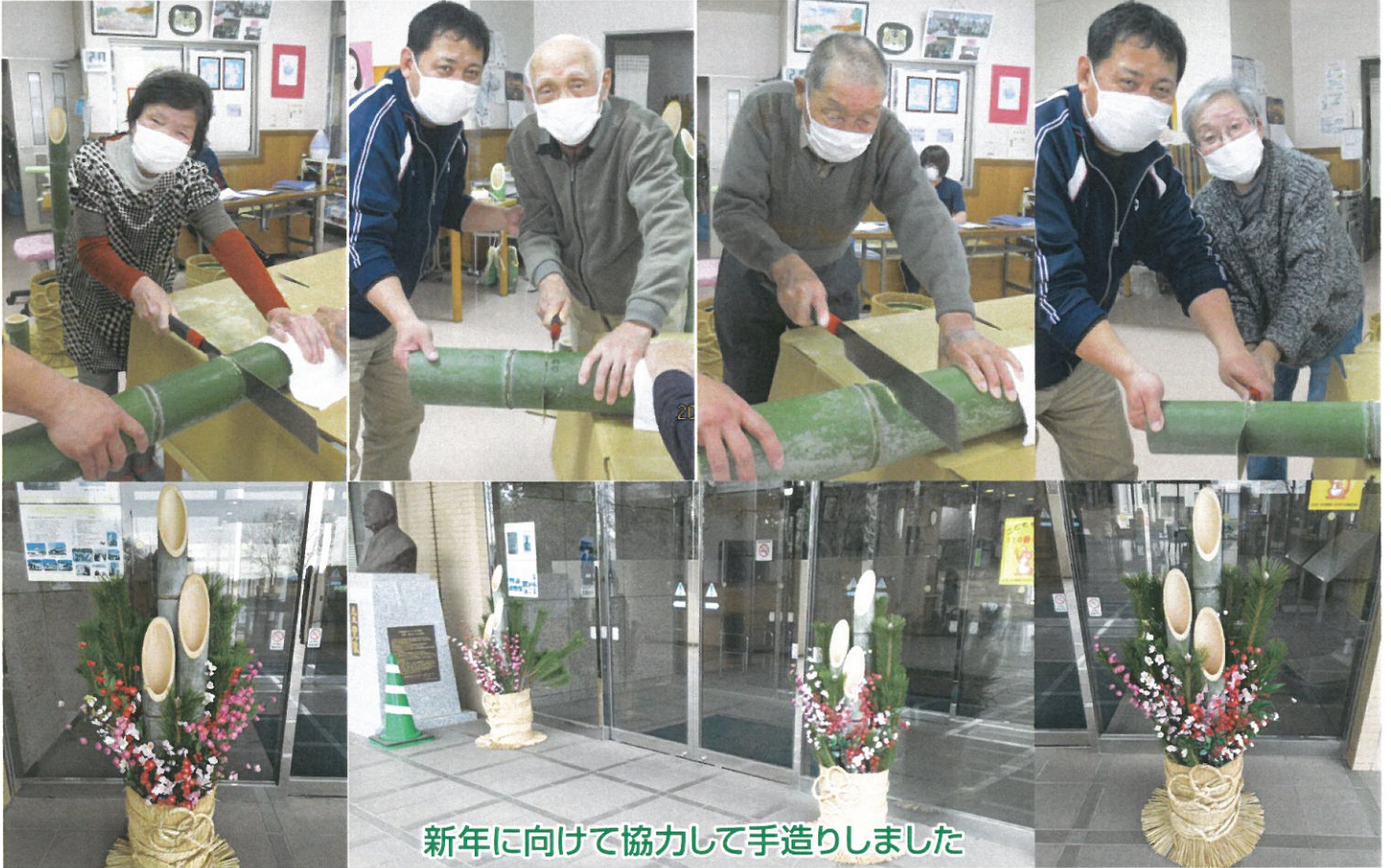
新年に向けて協力して手造りました