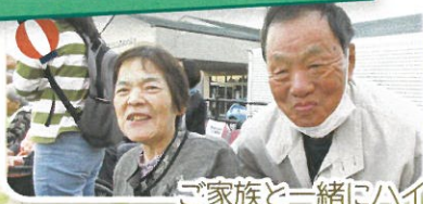
ご家族と一緒にハイ!!チーズ!!笑顔がこぼれます