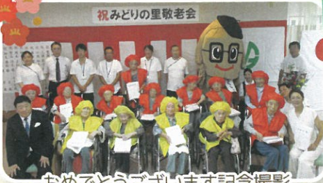
祝みどりの里敬老会 おめでとうございます記念撮影