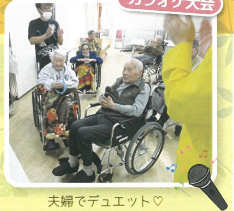
夫婦でデュエット♡