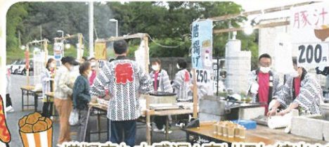
模擬店も大盛況!!売り切れ続出!!ありがとうございます(∩o∩)