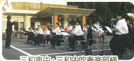
三和東中・三和中吹奏楽部様