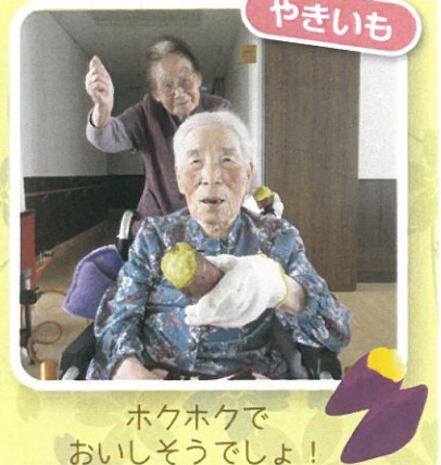
ホクホクで おいしょうでしょ！