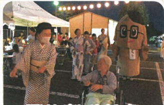
踊りも楽しめました