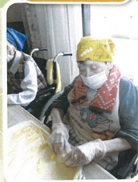
かりんとうドーナツ 上手にできたよ