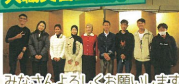
みなさんよろしくお祈りします