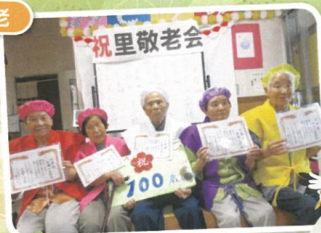
これからも元気でいてね!