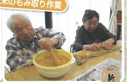
1粒1粒大事に大事に...