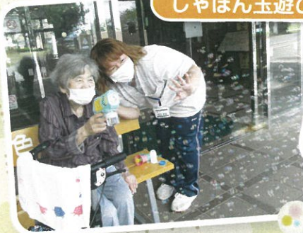
しゃぼん玉なつかしい〜