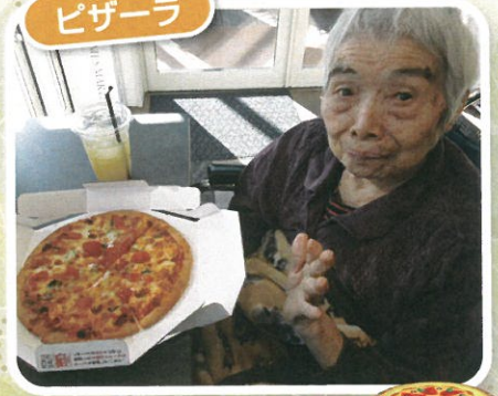
大きい! おいしそう!