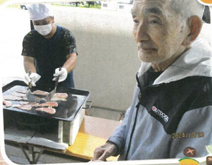
ウェルダムでたのむ!!