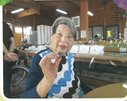
あまくておいしいよ