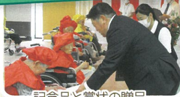
記念品と賞状の贈呈