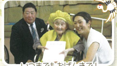
いつまでもおげんきで!