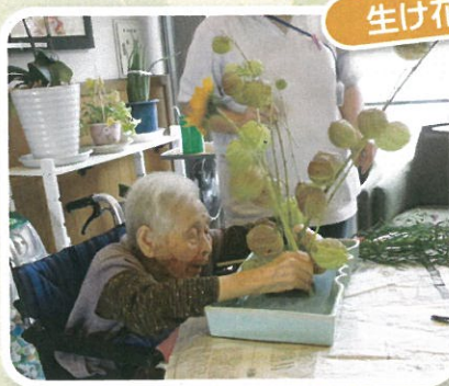
上手に出来るかな!?