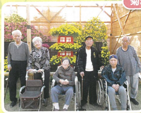
今年もキレイな菊を見て来たよ～♡