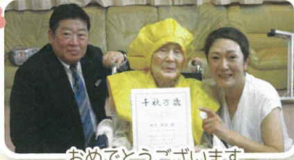
おめでとうございます 千秋万歳