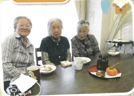
月よりダンゴがおたのしみ