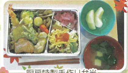
厨房特製手作り弁当