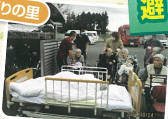
ベッド、車椅子の方も 避難しました