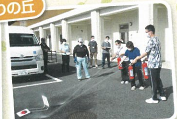
消火器の使い方を 学びました