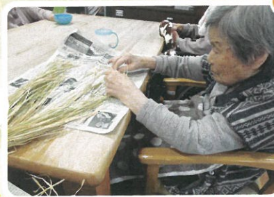
米のもみ取り作業