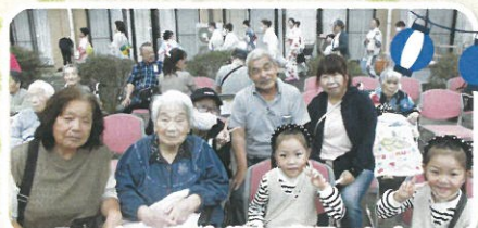
みつなみ商店街も盛況でした