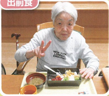
たまには出前もいいね