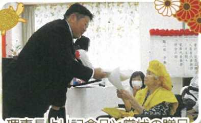
理事長より記念品と賞状の贈呈