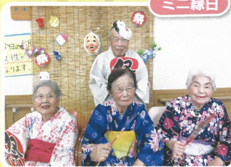
お祭りといったらやっぱり浴衣♡