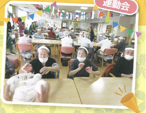
がんばれ白組！ファイトだ紅組！ 今年もいい戦いです^-^