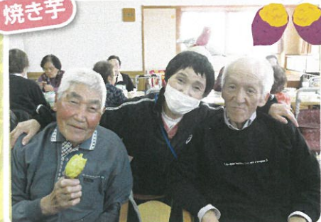
今年は芋売り姉さんが来ましたよ～(o^o)