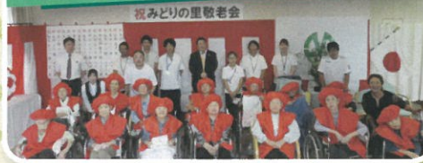
記念撮影おめでとうございます