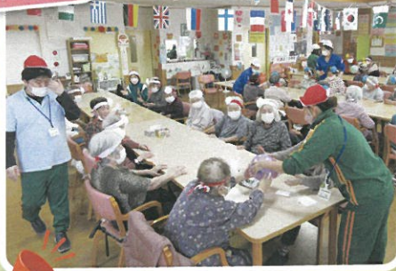
ガンバレ〜!! 負けるな!!