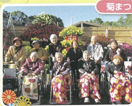
菊の花より美しい笑顔 ^_^