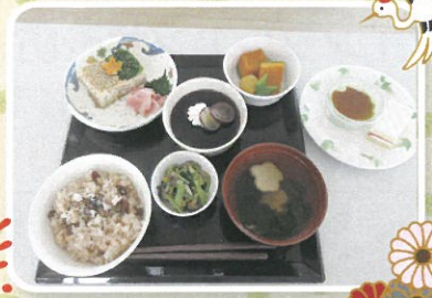
敬老の日おめでとうございます。皆さまの笑顔にみんな癒されています。 職員一同感謝を込めてお祝いいたします。