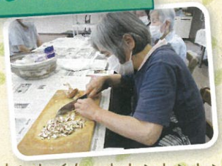
おいしいな〜れトントン