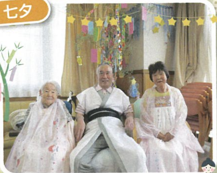
デイサービスの織姫と彦星