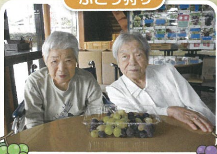
大変上手にとれて とても美味しいです