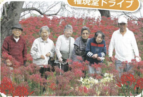
曼珠沙華にかこまれて