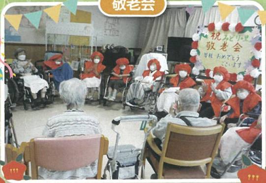
皆様おめでとうございます