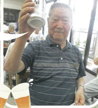
ケアハウスの居酒屋