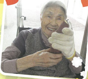
ホッカホカお芋 私もホカホカで〜す