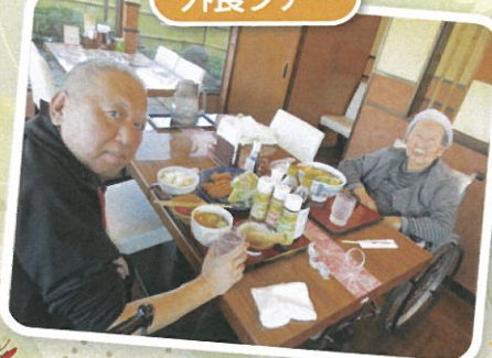
久しぶりの外食ツアー