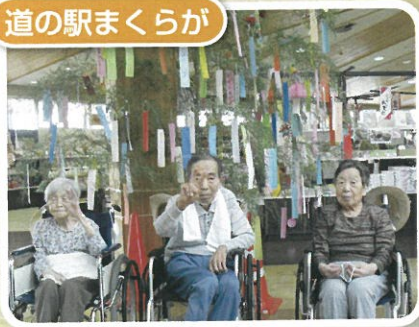
ショッピングですよ