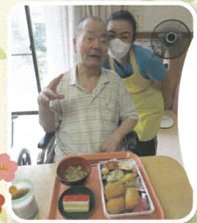
敬老会 特別弁当！ おめでとうございます！