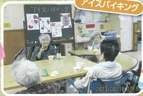
さっぱりとして美味しいね