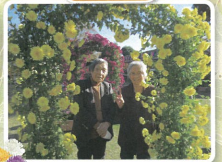
花にも負けない素敵な笑顔