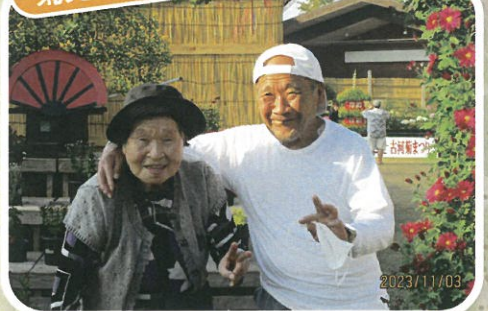
仲良しの2人 恋人? 親子?