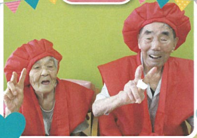
DS1の仲よし夫婦♡ 笑顔がステキ♡