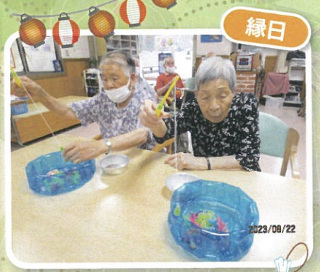
大きいのが釣れるかな