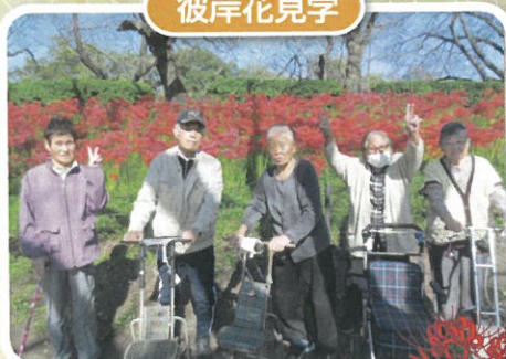
権現堂に行ってきました