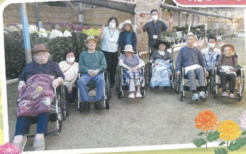
今年もきれいに咲いてました 大輪菊も見事でした