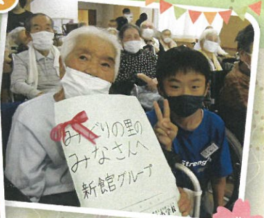
どうもありがとう