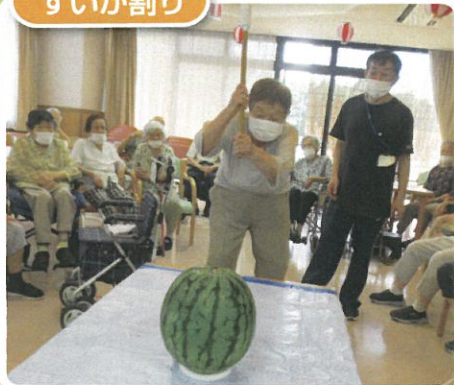
上手に割れるかな