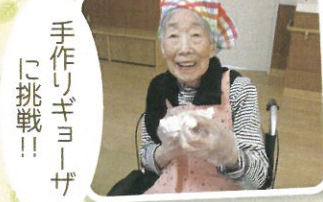
手作りギョーザ に挑戦!!