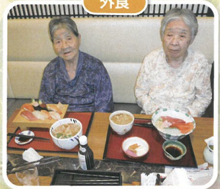
刺身がとっても美味しかったです