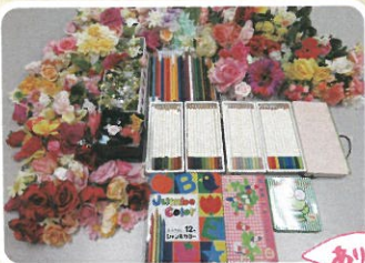
ありがとうございます