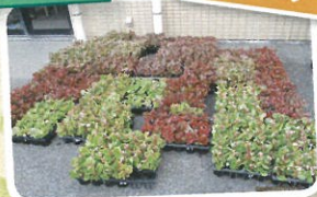
グリーンハウス小山様より いただきました