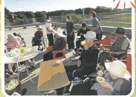
う〜ん、天気もいいし最高〜!