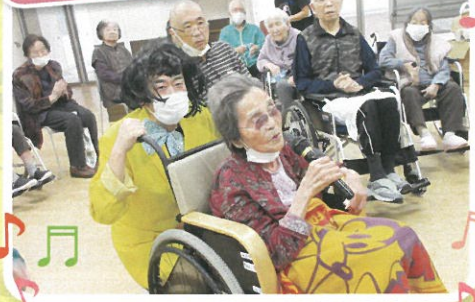
♪あ〜ソレソレのってるネ〜♪