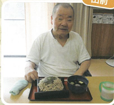
自分の好きな物が 食べられて満足です