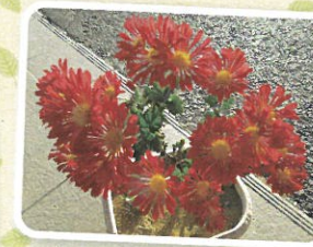
入居者様やご利用者様、ご家族様、 ご近所の方よりたくさんのご厚意を いただきました。 ありがとうございました。