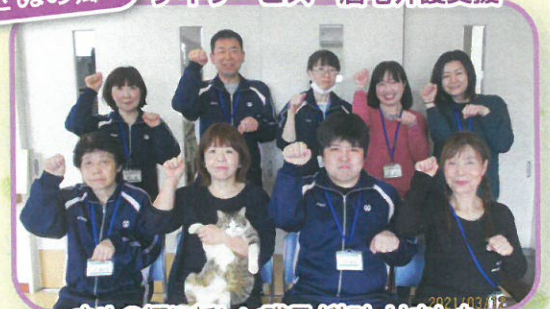
きめの郷に新しい職員が加わりました。 宜しくお願いします!