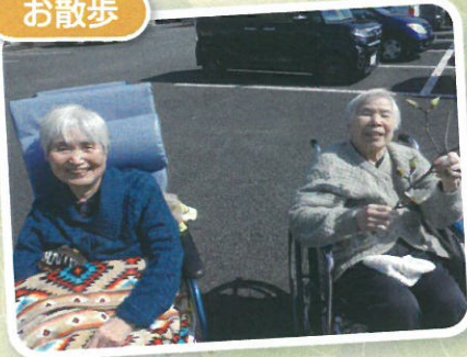
お天気のいい日はお散歩へ♡