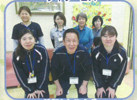
笑顔をたやみせず 明るく元気に頑張ります!!