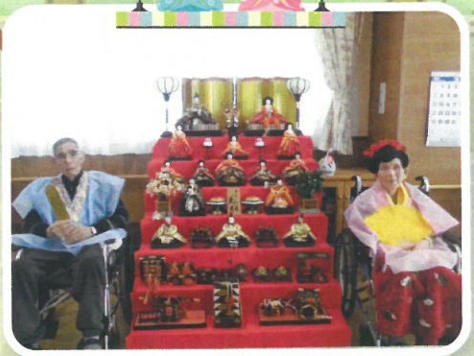
♪二人そろってすまし顔♪