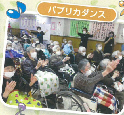
リモートで一緒にパブリカダンスを踊りました♪