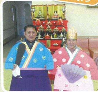
ステキなカップルの 誕生です♡