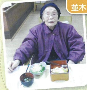
親子丼!美味しかったよ😊