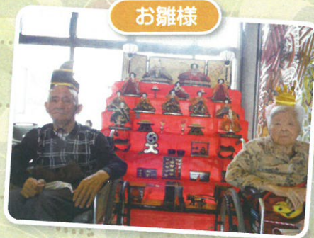
立派な雛壇の前で♡