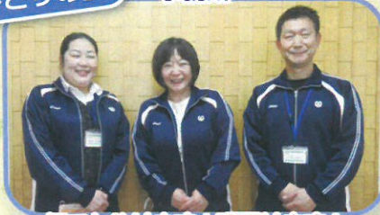
何でもやります!!頑張ります!!