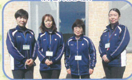
初心忘れず優しい心と笑顔