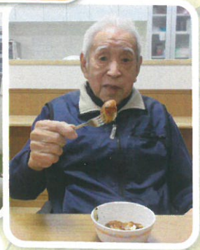
手作りたご焼き最高♪