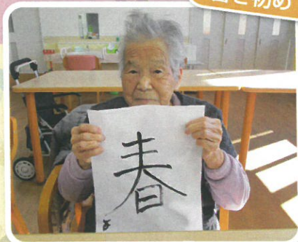
早く春が来ないかな～