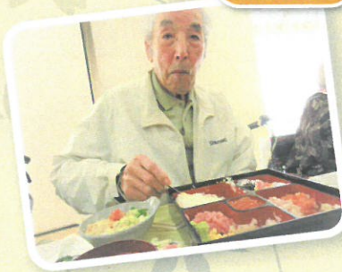
美味しそうですね