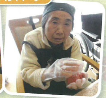
上手に出来るかな!?