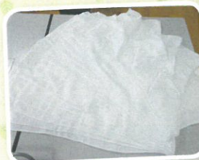
丘デイサービスのご利用者より タオルを頂きました