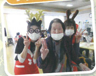
Xmas会盛り上がりました