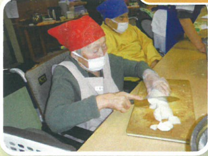
見事な包丁さばきです!