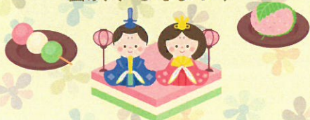
蕾咲く ひなまつり