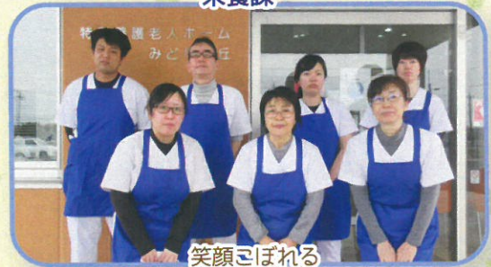
笑顔こぼれる 美味しい食事を提供します。