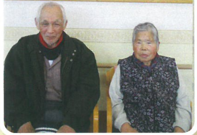
蕾咲く ひなまつり