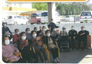
天気が良くて気持ち～♡