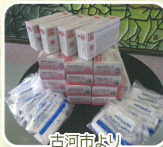
古河市より 使い捨てグローブを 頂きました