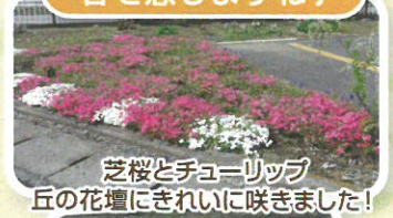
芝桜とチューリップ 丘の花壇にきれいに咲きました!