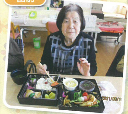
何から食べようかしら