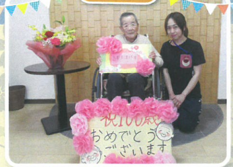
100歳を迎えられ益々お元気です おめでとうございます！