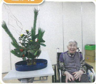
とっても上手に出来ました