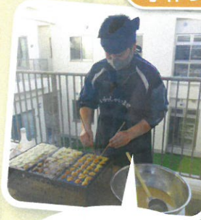
この人が作りました (須賀介護員)