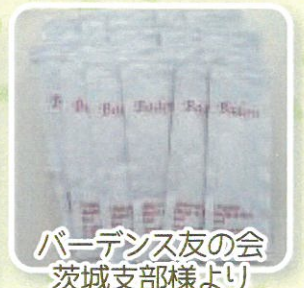
バーデンス友の会 茨城支部様より ハンドクリームを 頂きました