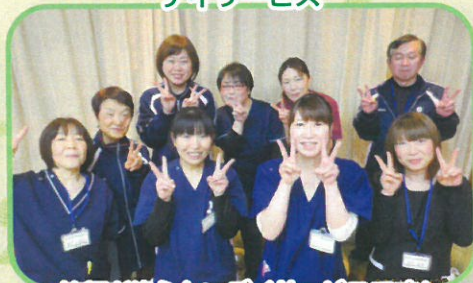
笑顔が絶えないデイサービスです!!