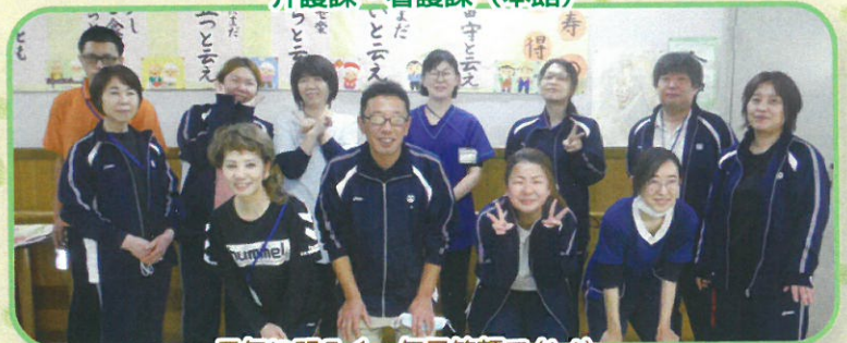
元気に明るく、毎日笑顔で(^^)