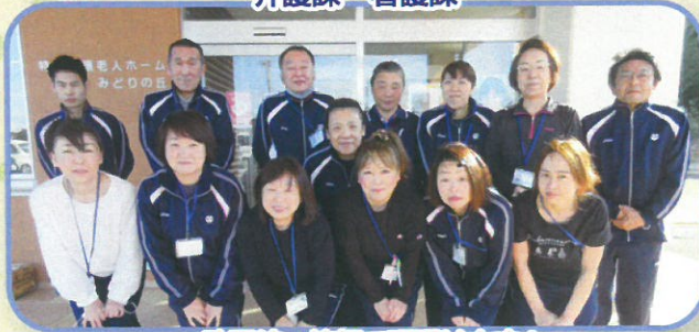
一致団結。笑顔で頑張ります!!