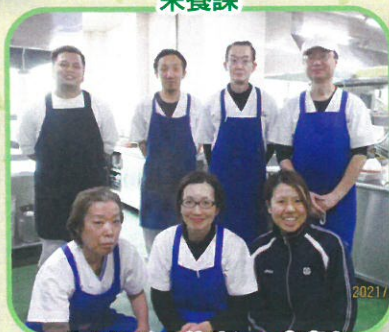
心を込めて美味しい食事を 作っています