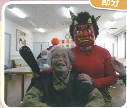
コロナ退治にきたぞ!!