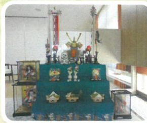
五月人形ご寄付を頂きました