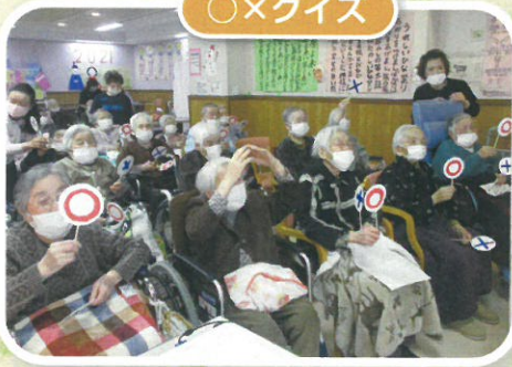
八俣小学校の皆さんに クイズを出されて…