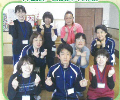
笑顔たえない、居心地の良い 時間を提供します!!