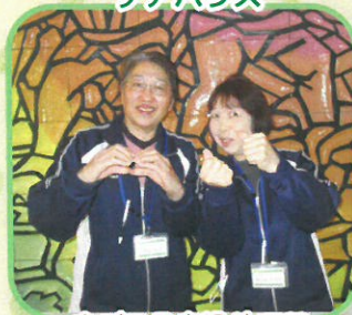
まごころを込めて♡