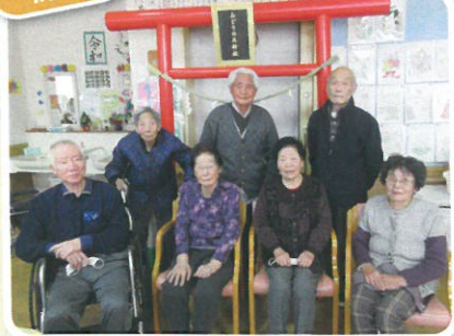
みどりの丘神社 ご利益ありますように…