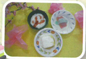
15時のおやつは バイキングでした!