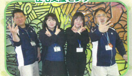
あなたの暮らしを応援します!!