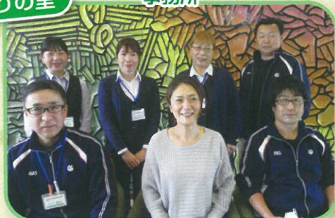
明るい笑顔でお待ちしております!!