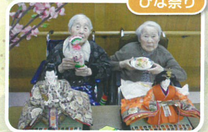
ひなあられとひし形ちらし寿司