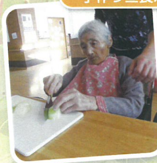
手作り昼食ハンバーグ