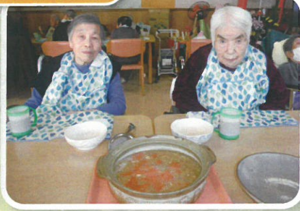
皆でおいしい鍋食べました♡