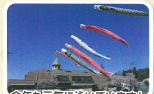
今年も元気に泳いでいます!